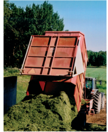
Vad innehåller grönmassan och det färdiga fodret? Analysen ger värdefulla svar!

Med IndividRAM5, som är baserad på NorFors fodervärderingssystem, tas hänsyn till både näringsinnehållet och utfallet av ensileringsprocessen. Den processen påverkar både näringsinnehåll och kornas ätlust.